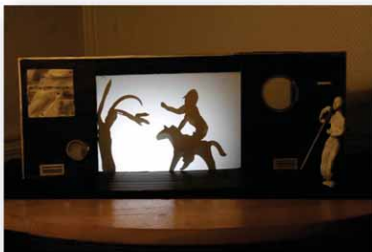
Scénographie - maquette

Espace scénique minimum requis (tous lieux, théâtre ou non) : ouverture 8 mètres, profondeur 6 mètres, hauteur 4 mètres.