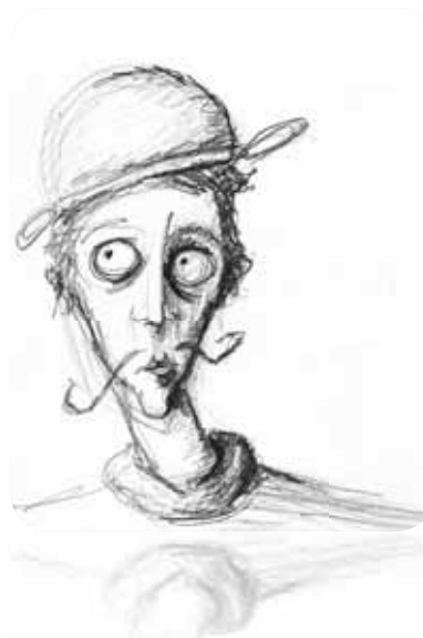
Illustrations du dossier Baptiste Gely

A dapté de la fameuse œuvre de Cervantès, " Don Quichotte de la Mancha, les aventures imaginaires d'un chevalier rocambolésque " est un spectacle jeune public s'adressant en particulier aux élèves de classes primaires et collèges.